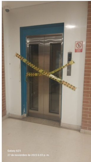
Centro de Tecnologías de la Construcción y la Madera

noviembre y aun así continúan prestando sus servicios de manera regular, poniendo en riesgo la salud de la comunidad educativa y llegando a situaciones denigrantes, como que cada trabajador tenga que cargar su balde de agua para poder ir al baño.