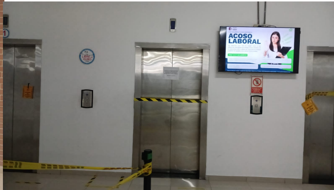
Centro de Gestión Administrativa