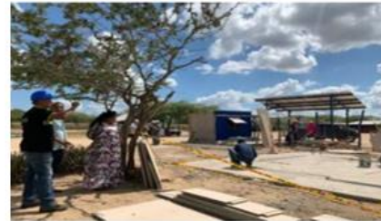
Aprendices e instructores de diferentes regionales del Sena, conviven y desarrollan proyectos en una comunidad wayuu.

Se desarrolla mediante retos relacionados con problemáticas particulares de las empresas, del entorno social o necesidades identificadas en un área específica dentro de un entorno productivo.