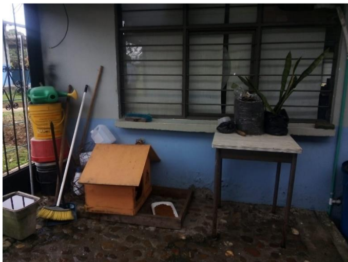
El área donde funciona el Grupo Administrativo y Financiero Intercentros tiene un pequeño patio, donde el benefactor de los gatos les ha instalado casa con recipientes con abundante alimento concentrado.

Cuando preguntamos a algunos de los trabajadores adscritos a esta área, nos dicen que ellos deben cambiar el alimento por orden del jefe, quien es “el que pone la plata” - disculpa típica del folclore colombiano - Ante esta respuesta algunos integrantes de SINDESENA procedimos a retirar estos recipientes, porque consideramos que bajo estas circunstancias es más importante hacer acciones para salvaguardar la salud de nuestros compañeros de trabajo que la preocupación por alimentar los gatos semisalvajes que invaden buena parte del centro de formación.