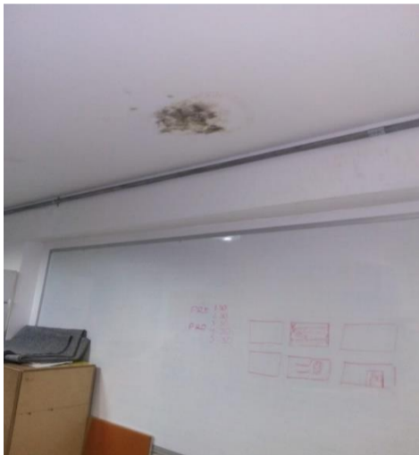
Mancha de humedad en el techo del ambiente de audiovisuales, por donde destilan líquidos fétidos

Los ambientes de audiovisuales, cuatro salones pequeños con equipos de alta tecnología concentran en su interior fuertes olores que producen los excrementos de estos felinos, ya que el techo falso sobre ellos ha sido tomado como refugio de los gatos, que simplemente deben salir unos cuantos centímetros para recibir el alimento de primera calidad que le suministra el experimentado funcionario del Grupo Administrativo y Financiero Intercentros del SENA, Regional del Cauca.