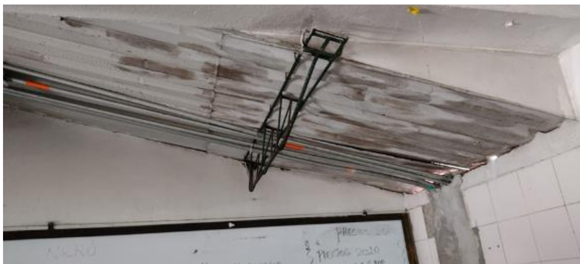
Casino en general en mal estado, se requiere la construcción de una estructura que cumpla con todas las normas para la preparación de alimentos y sea un lugar seguro