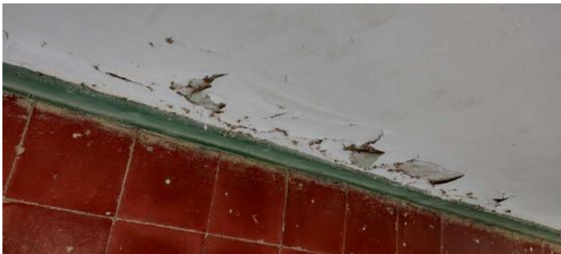
Humedad en paredes, techos en casi la totalidad del Centro, pisos irregulares y en mal estado