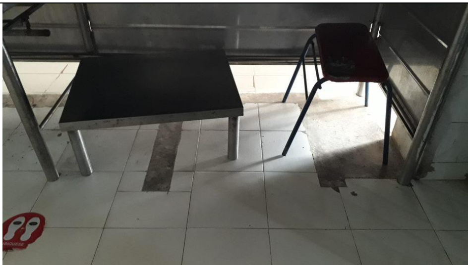
Piso en el casino en mal estado, paredes e infraestructura en general