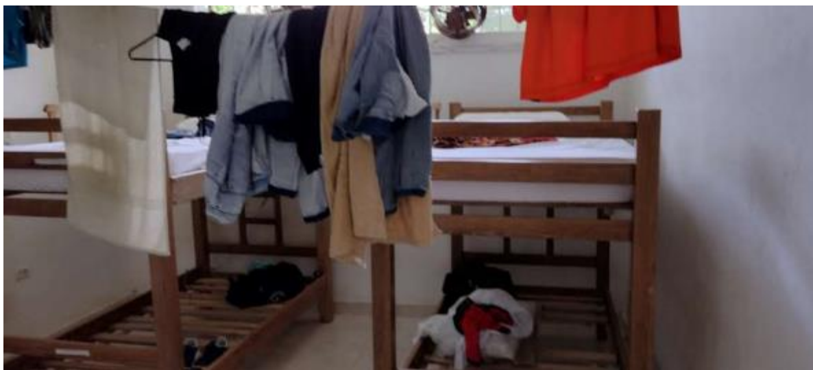
Dormitorios aprendices en completo desorden y desaseo, con precarias condiciones en la infraestructura.