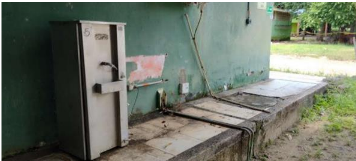
Pisos irregulares y en mal estado, pasillos con múltiples materiales