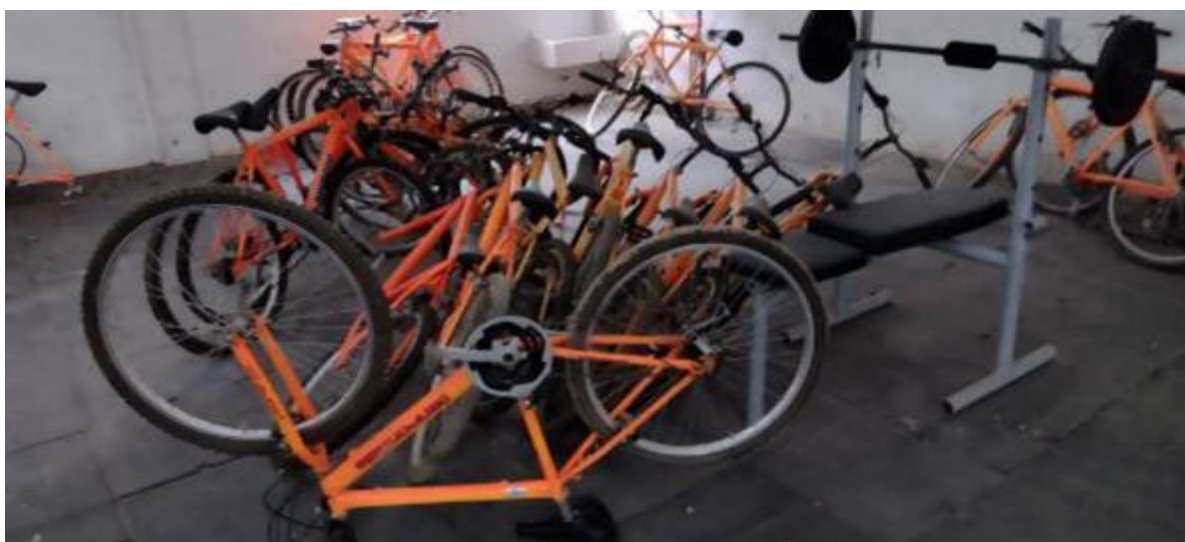
Bicicletas para la movilidad en el Centro sin mantenimiento