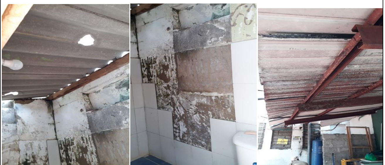
Estructura al interior del casino en mal estado y unidad sanitaria para los trabajadores en pésimas condiciones