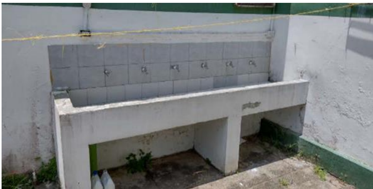
Lavadero de ropa de aprendices en mal estado