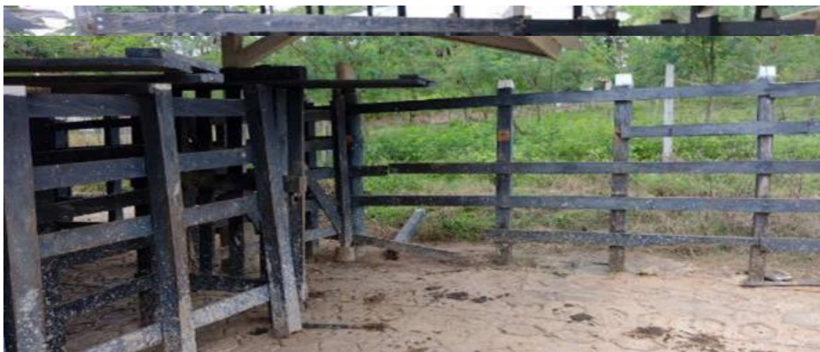
Corrales en muy mal estado, que ponen en riesgo a quienes trabajan en estas condiciones.

En los archivos de hace varios años reposan evidencias similares a las que hoy están presentes en este Centro de Formación y ojalá que no se escuchen voces como las de esa época, que expresaban sin sentido frases como “Aquí los muchachos están mejor que en sus casas” “Quien sabe en qué condiciones dormirán” “Aquí tienen las tres comidas seguras” , con esto se entendía que aunque tenían una cama no importaba sus condiciones que podrían hoy ser iguales