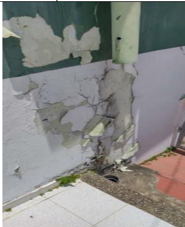
Humedades en pisos paredes y techos carcomiéndose el Centro