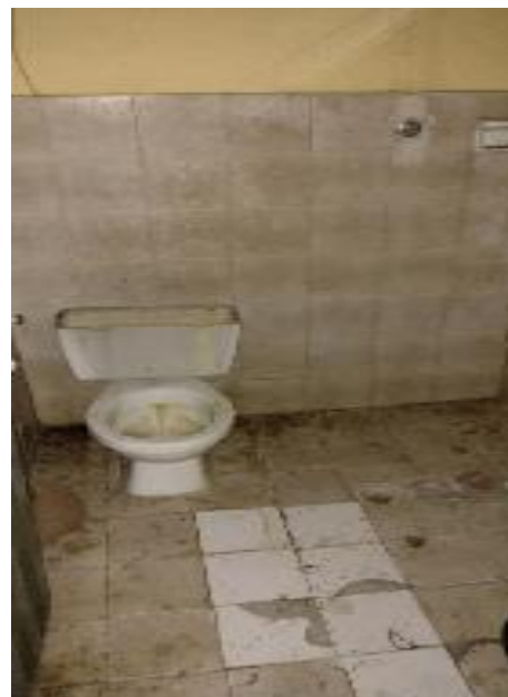
Unidades sanitarias en mal estado, esta última es en el cuarto donde se guardan instrumentos