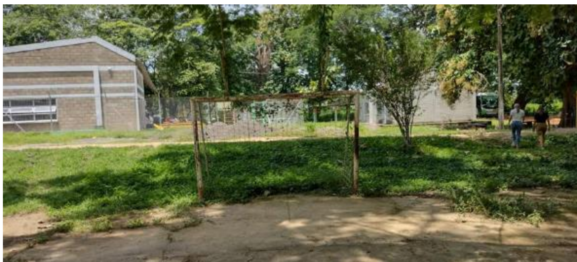
Polideportivo para la práctica del deporte en pésimo estado