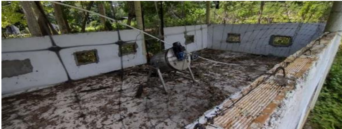
Galpón para cría de especies menores en completo abandono