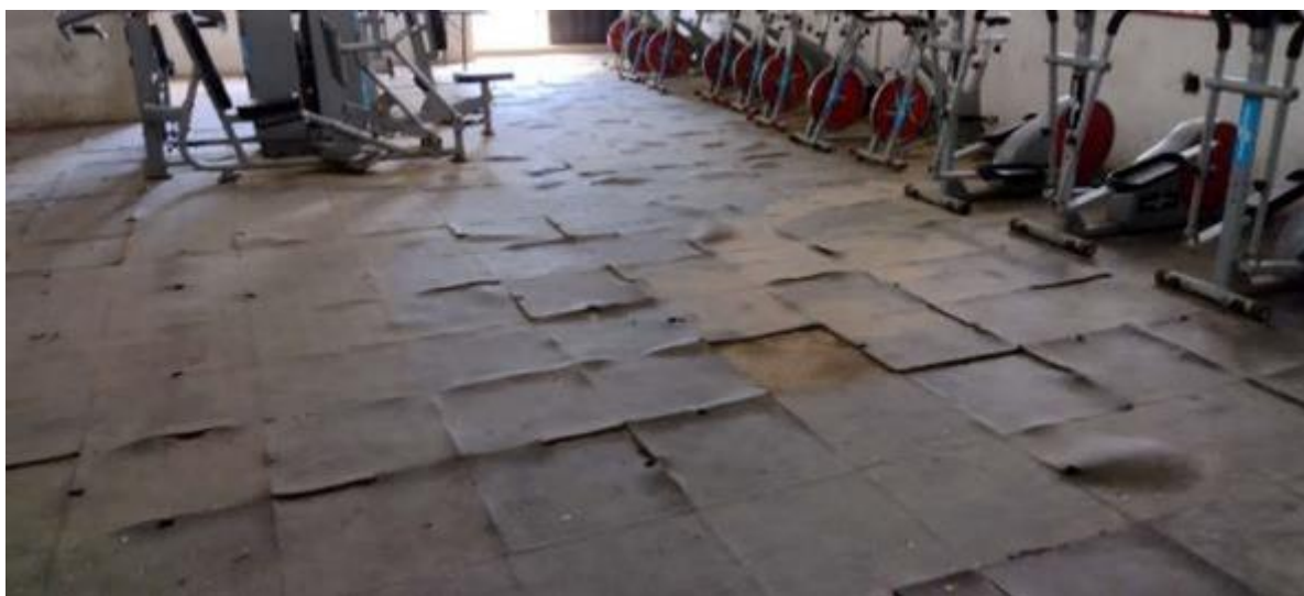
Gimnasio en muy mal estado, piso irregular en mal estado sin mantenimiento y sin aseo, con humedades y paredes en mal estado