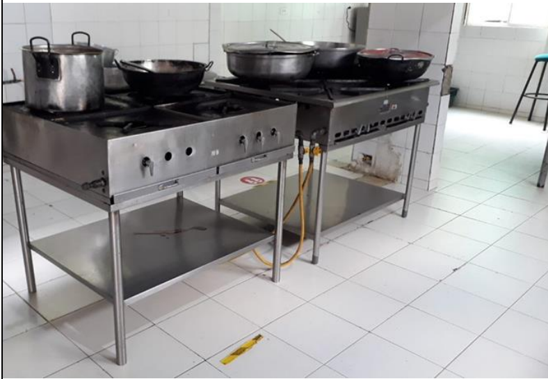
Estufas y demás equipamiento en mal estado, además de conexiones inseguras