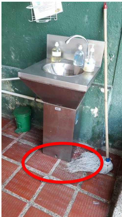
Lavamanos inservible con el pedal desprendido y pared en mal estado