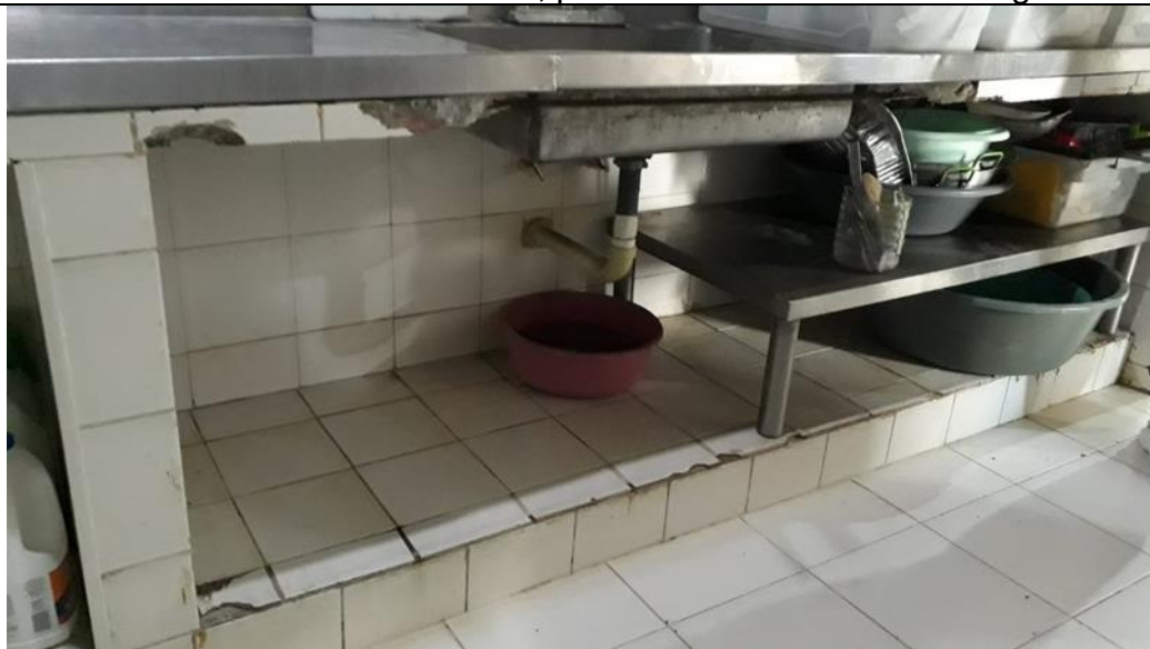
Estructura completamente deteriorada