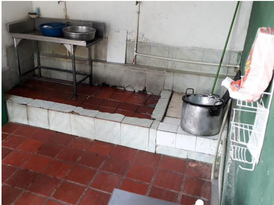
Se incumple la Resolución 2674 de 2013 y demás normas vigentes que garanticen la inocuidad de los alimentos