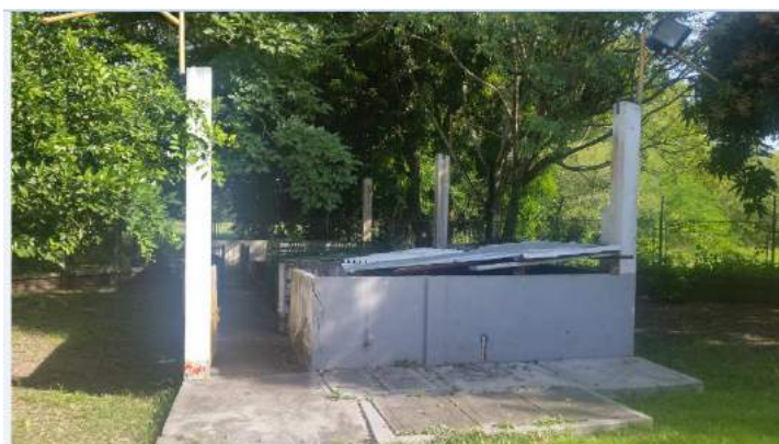
Área de producción de cerdos sin techo y abandonada.

Desde Diciembre de 2015, SINDESENA presentó ante la Dirección Regional las lamentables condiciones que se tienen en las instalaciones de la sede de Puerto Boyacá perteneciente el Centro Pecuario y Agroempresarial, tales como el área de producción de cerdos destechada y abandonada, el área de producción avícola completamente abandonada y deteriorada, un ambiente de formación con fisuras estructurales abandonado y sin atención; mientras se atienden formaciones en un ambiente abierto e inicialmente diseñado para actividades lúdicas.