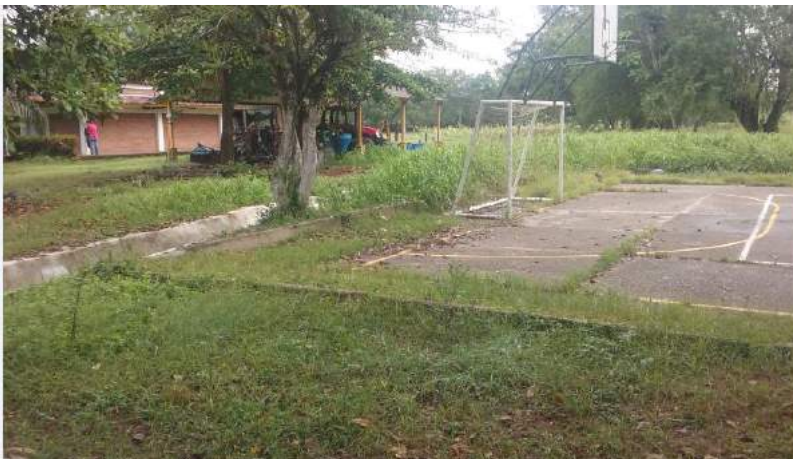
Áreas deportivas sin mantenimiento adecuado